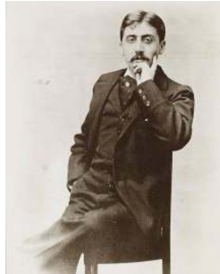
Marcel Proust (1871 - 1922)

Hoewel het modernisme erfgenaam van het realisme was, ontwikkelde het een onmiskenbaar nieuwe fase in de cultuurgeschiedenis van Europa en Amerika toen de Industriële Revolutie een hoogtepunt bereikte, d.w.z. voordat de draadloze radio, de gloeilamp en het Ford-model T werden uitgevonden en de burgerluchtvaart en filmindustrie tot ontwikkeling kwamen. Parijs was het epicentrum. Heart of Darkness van Joseph Conrad (1857-1924), À la recherche du temps perdu , de zevendelige roman van Marcel Proust (1871-1922), Der Zauberberg van Thomas Mann (1875-1955), Ulysses van James Joyce (1882-1941), To the Lighthouse van Virginia Woolf (1882-1941), Das Schloss en Der Prozess van Franz