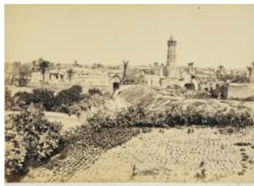
Gaza, The Old Town - 1857