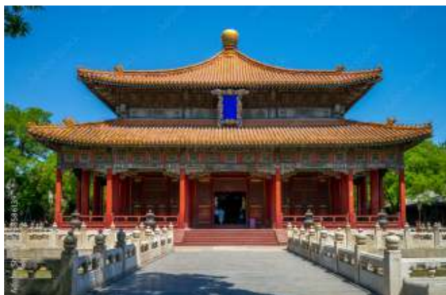
Imperial Academy in Beijing, China