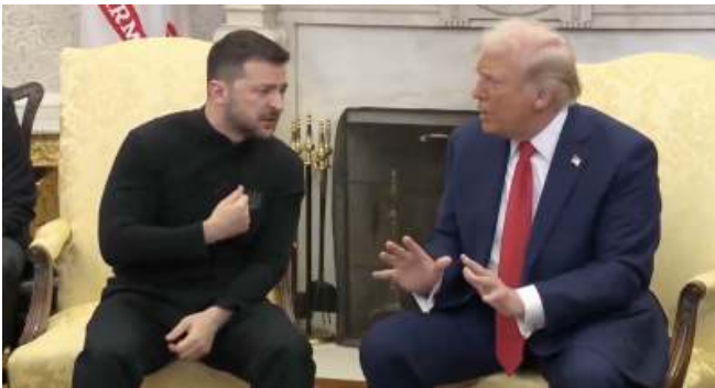
Trump en Zelensky - 28 februari 2025 - White House

Oekraïne: Nog nooit vertoond. Vredesonderhandelingen over Oekraïne die gevoerd worden in Qatar, zonder dat de tegenpartij Rusland aanschuift en het subject van deze oorlog (pardon: speciale operatie ...) Oekraïne alleen de kans wordt geboden op een papiertje, waarop wel tekst staat maar waarop ze geen invloed hebben gehad, bij het kruisje te tekenen. Gevraagd naar vredesgaranties (tijdens een bezoekje van Zelensky aan het Witte Huis) worden hem de oren door president Trump en vicepresident Vance grondig gewassen. "Jij hebt geen goede kaarten in de hand!". (Alsof oorlog te vergelijken is met een partijtje poker.) Waarop Trump Zelensky het White House uitgooit en alle verdere wapenleveranties aan Oekraïne stopzet. Trump telefoneert ook nog met Poetin en zegt Poetin toe dat hij alle al veroverde gebieden mag houden (alsof Trump over Oekraïens grondgebied gaat!). Maar amper een week later trekt Trump zijn sancties jegens Oekraïne weer in. (Nog een kanttekening: welbeschouwd, maar onuitgesproken, gaat deze oorlog / speciale operatie om de bodemschatten van Oekraïne, van belang voor Trumps vriend Elon Musk. Rijdt u Tesla?)