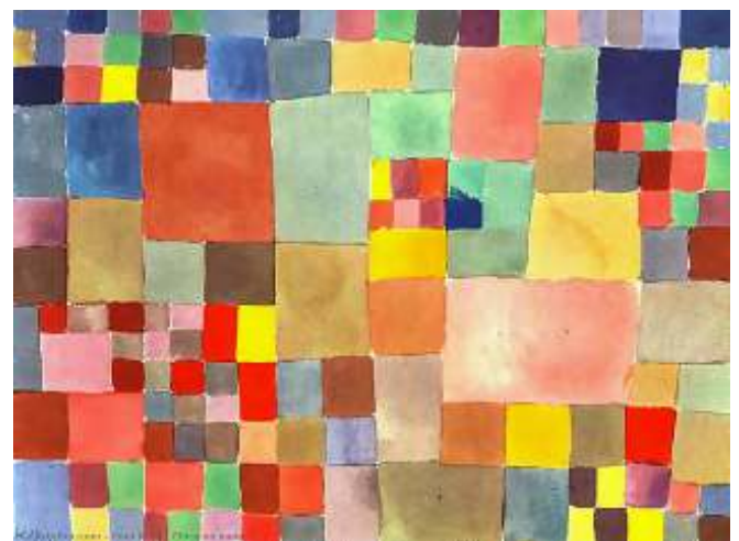
Paul Klee (1879 - 1940) - Flora op zand