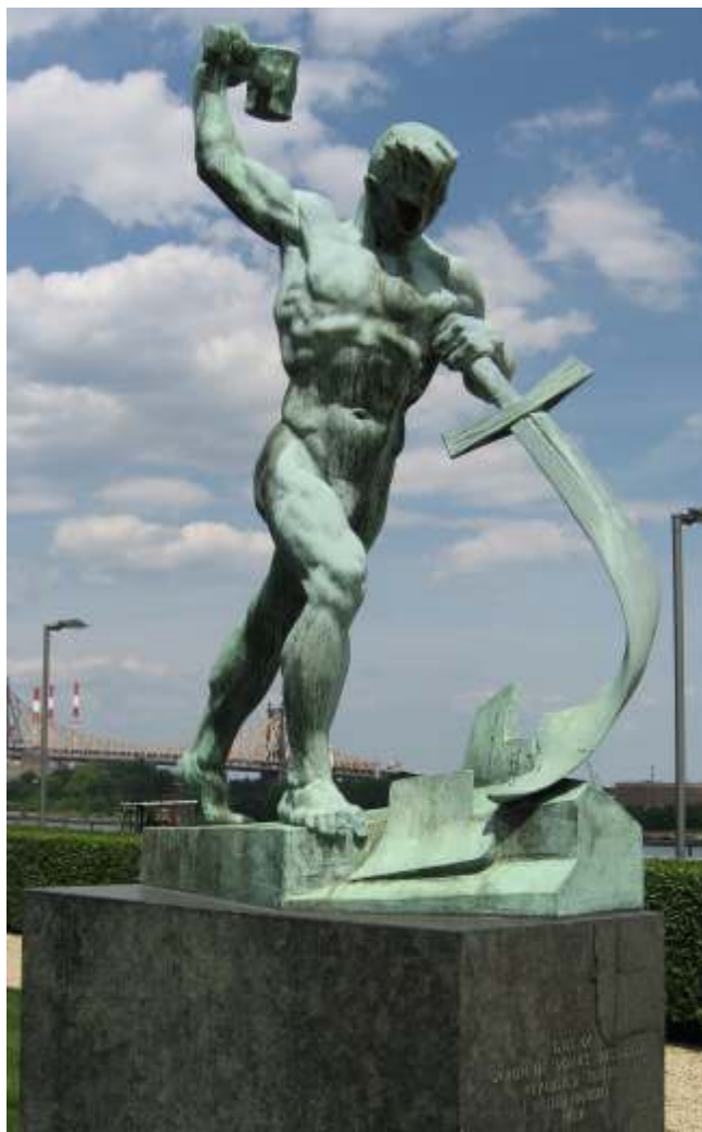
Het beeld 'Let Us Beat Swords Into Ploughshares' staat bij het VN-gebouw in New York. Het werd in 1959 geschonken door de USSR aan de Verenigde Naties. Secretaris-generaal Dag Hammarskjöld nam het beeld in ontvangst namens de organisatie.

Op het gebied van Internationale vrede en veiligheid geldt het Non-Proliferatieverdrag (NPV) algemeen als een van de belangrijkste internationale initiatieven voor vermindering van kernwapens. Het is gebaseerd op drie