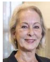
Samengesteld door Marjolijn Snippe (redactie Eén Wereld)

Manière de voir 28, Le Monde Diplomatique , Les Nouveaux Maîtres du Monde, november 1995.