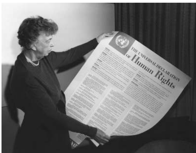
Eleanor Roosevelt met de Universele Verklaring

De Universele Verklaring is het kroonjuweel van de bijdragen van de VN aan de mensenrechten. De UVRM was niet bedoeld als een verdrag maar als een verklaring van algemene principes van mensenrechten en vrijheden om